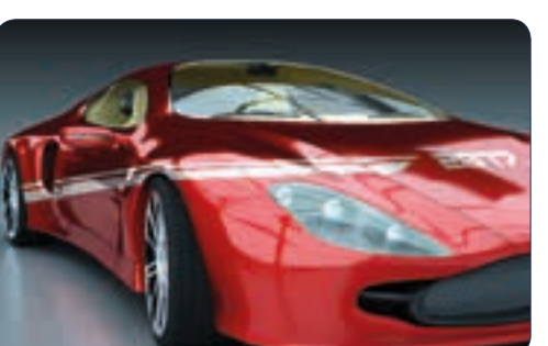
VOITURE | n° 26 718 - Plastifié n° 26 118 - Polyester laminé