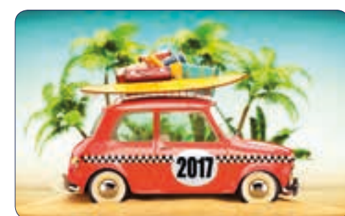
VACANCES | n° 26 705 - Plastifié n° 26 105 - Polyester laminé