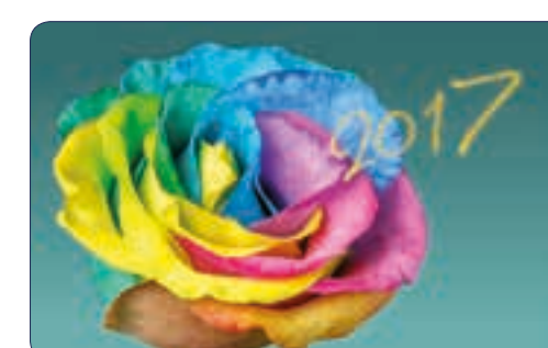
ROSE | n° 26 711 - Plastifié n° 26 111 - Polyester laminé