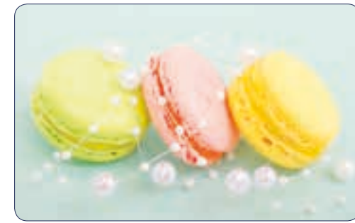
MACARONS | n° 26 721 - Plastifié n° 26 121 - Polyester laminé