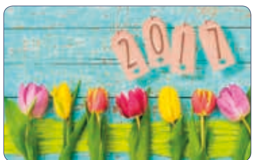
TULIPES | n° 26 719 - Plastifié n° 26 119 - Polyester laminé