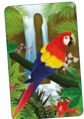
PERROQUET n° 26 707 - Plastifié n° 26 107 - Polyester laminé