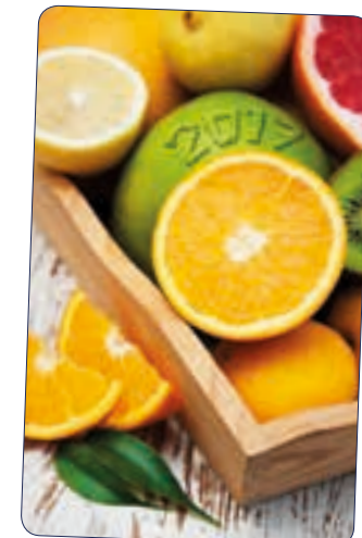
AGRUMES n° 26 706 - Plastifié n° 26 106 - Polyester laminé