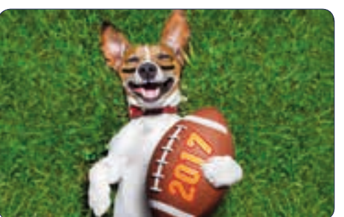
RUGBY | n° 26 713 - Plastifié n° 26 113 - Polyester laminé