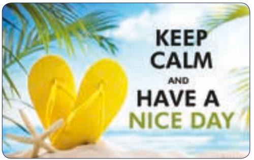
PLAGES | n° 26 722 - Plastifié n° 26 122 - Polyester laminé

FORMAT UNIQUE 86 x 54 mm format carte bancaire