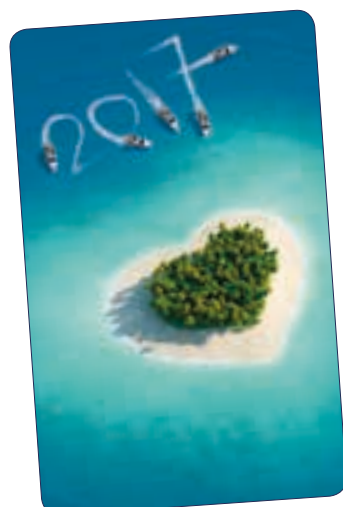
COEUR n° 26 701 - Plastifié n° 26 101 - Polyester laminé