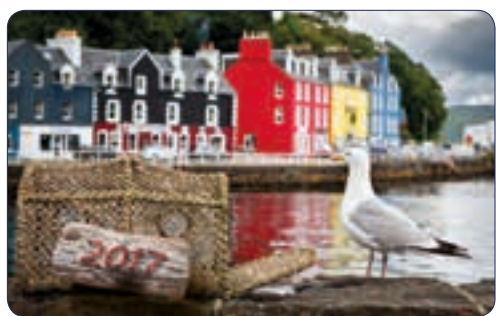
MOUETTE | n° 26 709 - Plastifié n° 26 109 - Polyester laminé