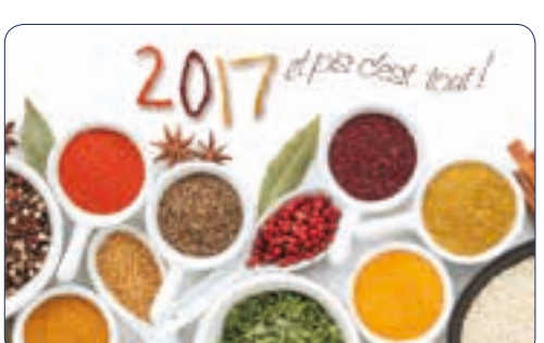
ÉPICES | n° 26 715 - Plastifié n° 26 115 - Polyester laminé