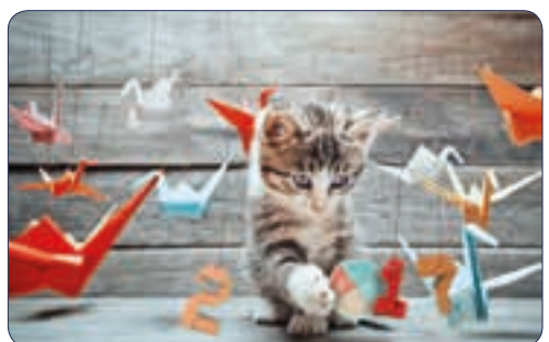
CHATON | n° 26 703 - Plastifié n° 26 103 - Polyester laminé