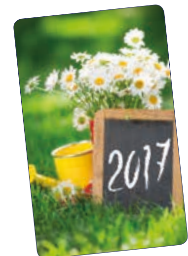
JARDIN n° 26 717 - Plastifié n° 26 117 - Polyester laminé