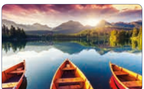
BARQUES | n° 26 704 - Plastifié n° 26 104 - Polyester laminé