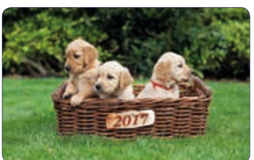
CHIOTS | n° 26 720 - Plastifié n° 26 120 - Polyester laminé